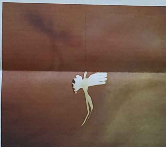
Voor de muzikale meditatie Lonely Angel ging Peteris Vasks uit van het visioen van een engel die over de wereld vliegt, met tranen in de ogen nadenkend over de toestand van de aarde.